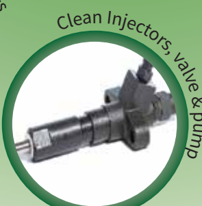
Clean Injectors, valve & pump

সকল ধরনের গাড়ির জন্য Dipetane সম্পূর্ণ নিরাপদ এবং ব্যবহার উপযোগী। শুধু গাড়ির জন্যই নয় এটা যেকোন ধরনের Diesel Cars, Petrol Cars, Hybrid Cars, Motorbike Engines, 2-Stroke or 4-Stroke Engines এছাড়াও Industrial Generators, Marine Engine, Bus-Truck এর জন্যও একটি নিরাপদ Zero Additive Fuel Treatment lubricant.