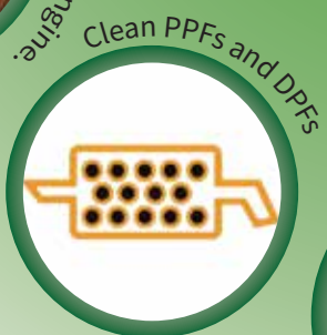
Clean PPFs and DPFs