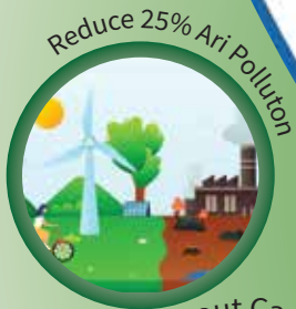
Reduce 25% Air Pollution