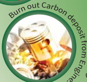
Burn out Carbon deposit from Engine